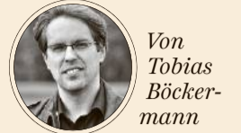
Von Tobias Böckermann

Und das soll ein Erfolg sein? 487 Sauen und 100 Eber sind vom Bunten Bentheimer Schwein noch übrig geblieben – deutschlandweit. Angesichts von 27,3 Millionen Schweinen, unter ihnen 1,9 Millionen Zuchtsauen, die es im November 2016 bei der jüngsten Erhebung des Statistischen Bundesamtes in Deutschland gab, ist das so gut wie nichts. Die Zahlen zeigen eindrucksvoll: Schweinefleisch ist ein Produkt, das für den Weltmarkt produziert wird. Wer Erfolg haben will, muss viele Faktoren zusammenbringen wie den Futtermittelverbrauch, die Energieeffizienz oder die Schlachtkörperqualität. Und gerade deswegen sind seltene Rassen so wichtig. Denn wenn in der globalen Schweinezucht Fehler gemacht werden, wirkt sich das auf Millionen Tiere und Zehntausende Betriebe aus.